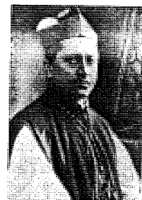
■ August Hlond